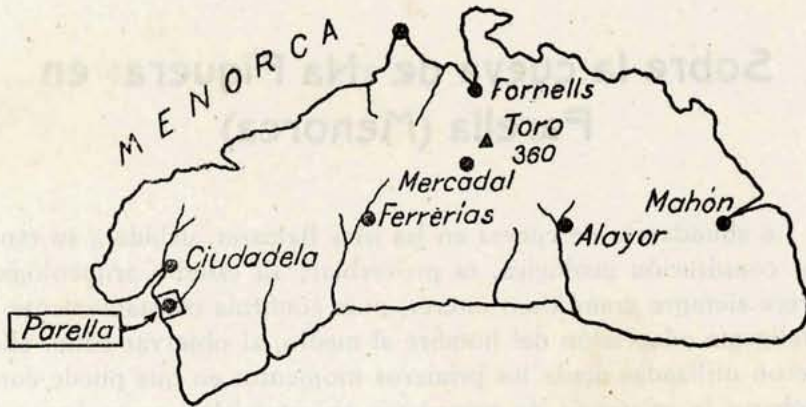
Fig. 1.ª—Situación de la cueva de «Na Figuera» en Parella (Menorca)

bien sabido en una multiplicación de las cuevas existentes por construcción de covachas artificiales y transformación y adaptación de oquedades naturales. El estudio de todas las cuevas utilizadas nos muestra matices del más alto interés, uno de ellos es el de la búsqueda y aprovechamiento del agua, siempre de gran importancia, acrecentada en el caso que nos ocupa por su escasez en amplias zonas de estas islas. Quizás sea ésta una de las causas que motivaron en ellas la búsqueda de las cuevas y su utilización como viviendas. Sin embargo, los datos que de ellas poseemos son bastante escasos